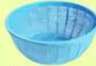
ตะกร้ากรองเศษอาหาร ใช้เป็นตะแกรงกรองเศษอาหาร